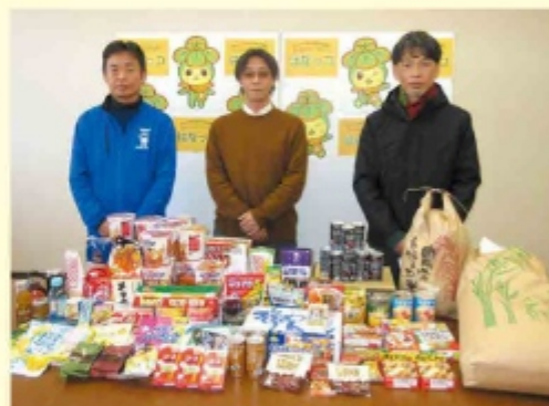
社会福祉法人正友会 様より