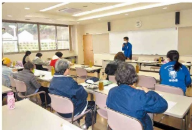
▲訪問介護事業所ランチミーティング（研修）の様子