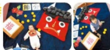
節分フォトアート