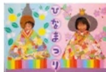
顔出しおひなさま