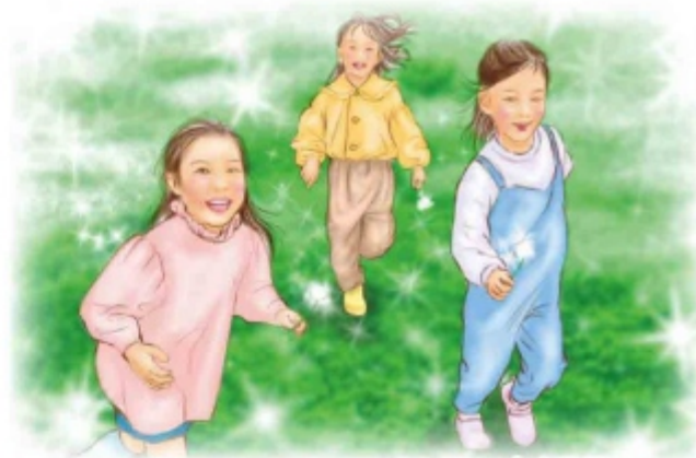
イラスト 山本恭子さん